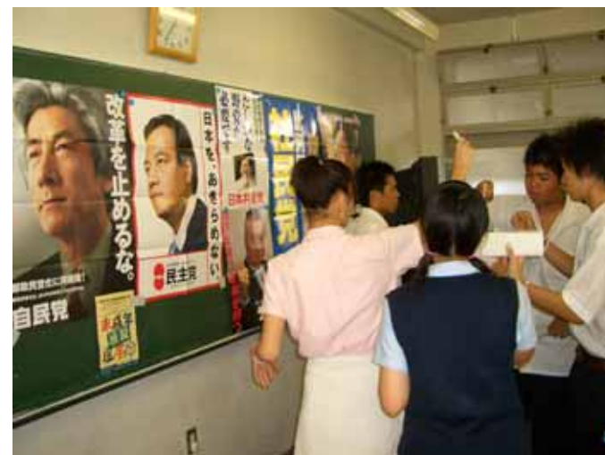
学校投票@玉川学園高等部