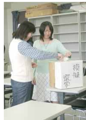
ユース“模擬”総選挙2003