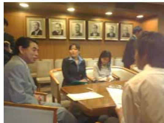
政党本部探検ツアー(参院選04)@自民党本部

各選挙区内で行なわれる、主要候補者を招いた公開討論会に参加する。事前に主催者と交渉し、「未成年者席」を確保してもらうことが可能です。