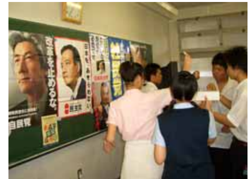
未成年「模擬」総選挙2005 @玉川学園高等部