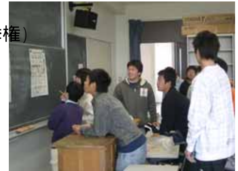
選挙公報を見る高校生(03年東京都知事選挙)