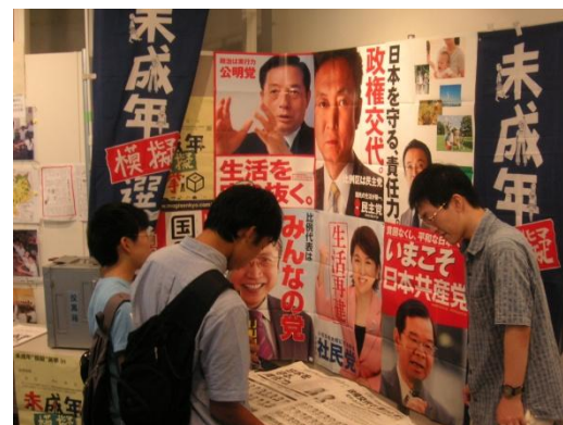
△投票風景@新宿のイベント会場にて