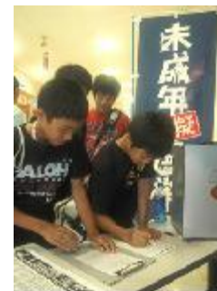
△街頭投票の様子@三重